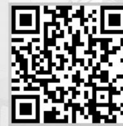
رضایت نامه های شرکت