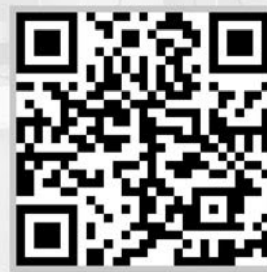
مدارک فنی پرسنل شرکت